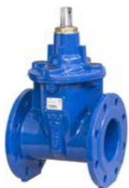
Válvula compuerta cierre elástico PN16 F-4