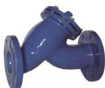
Filtro en "Y" PN16