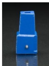
Volantes y cuadradillos