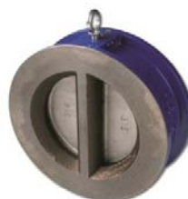
Válvula retención de doble plato PN16