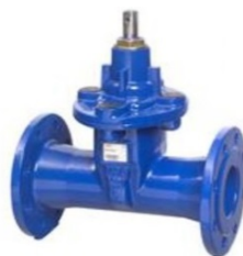
Válvulas compuerta cierre elástico PN16 F-5