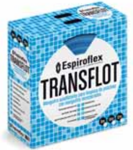
Conjunto mangueras en cajas