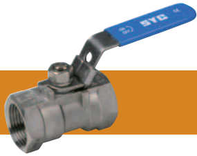
Válvula de esfera una pieza Válvula de esfera 1 corpo Vanne a sphere une piece