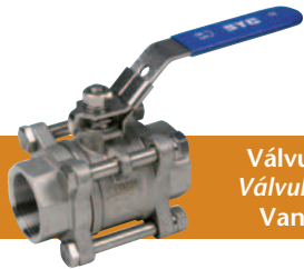
Válvula de esfera tres piezas paso total Válvula de Esfera 3 corpos passagem total Vanne a sphere a trois pieces passage