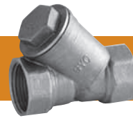
Filtro en "Y" Filtro em "Y" Filtre en "Y"