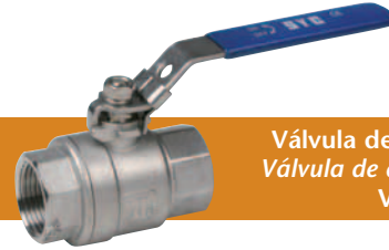
Válvula de esfera dos piezas paso total Válvula de esfera 2 corpos passagem total Vanne a sphere a deux pieces