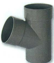
Derivación macho-hembra 67° 30