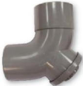
Conexión bajante registrable m-h 87° 30