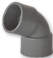
Codo hembra-hembra 67° 30