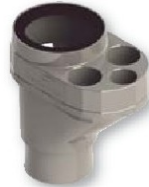
Injerto multiconexión 110-50-50-40