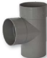
Derivación hembra-hembra 87° 30