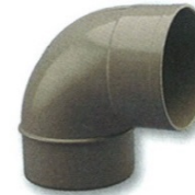
Codo Macho-hembra 87°30