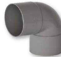
Codo hembra-hembra 87° 30