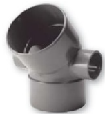
Codo macho-hembra 45° con doble toma lateral 50