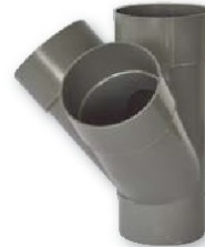
Derivación doble a escuadra mh- 45º