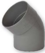
Codo macho-hembra 45°