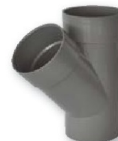
Derivación macho-hembra 45°