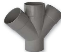
Derivación doble plana macho-hembra 45°