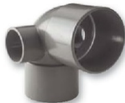
Codo macho-hembra 87° con doble toma lateral 50