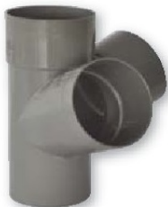
Derivación doble a escuadra mh- 67º30