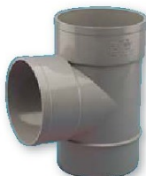
Derivación macho-hembra 87° 30