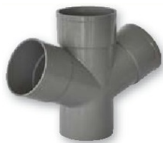
Derivación doble plana macho-hembra 67º30