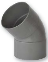
Codo hembra-hembra 45°