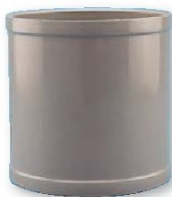
Manguito union hembra-hembra