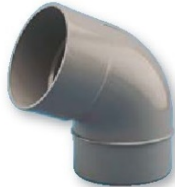
Codo Macho-hembra 67°30