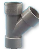
Derivación hembra-hembra 45°