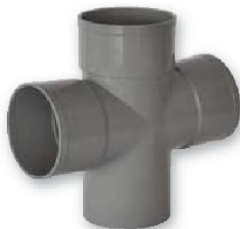
Derivación doble plana macho-hembra 87º30