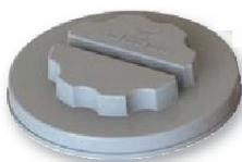
Tapón registro roscado