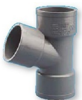
Derivación hembra-hembra 67° 30