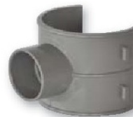
Inierto a tubo 90º