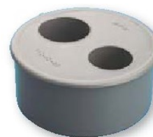
Tapón reducción doble macho-hembra