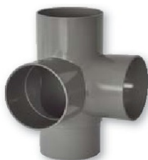
Derivación doble a escuadra mh- 87º 30