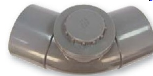
Codo registrable hembra-hembra 45°