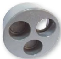
Tapon reducción tripe ciego