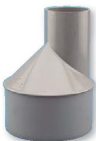
Reducción sanitaria macho-hembra