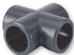
Cruz pvc presión encolar