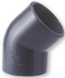
Codo h-h pvc presión encolar 45º