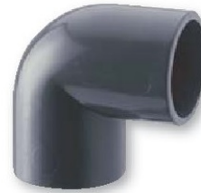
Codo h-h pvc presión encolar 90º