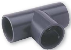
Te pvc presión encolar 90º