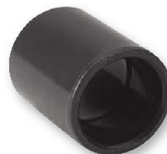
Manguito pvc presión encolar