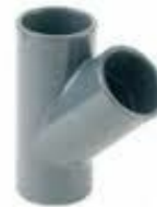
Te pvc presión encolar 45º