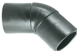
Codo pe100 inyectado 45º