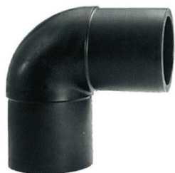
Codo pe100 inyectado 90º