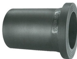
Portabridas pe100 inyectado